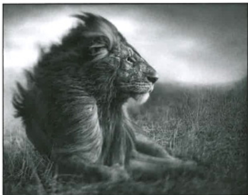
Lion fotograferet av Nick Brandt

I 2000 startet han på sin storslåtte boktrilogi som feirer Øst-Afrikas truede, storslåtte natur. Den første delen, On This Earth , inneholder 66 fotoer tatt i perioden 2000-2004. Den andre delen, A Shadow Falls , har 58 fotoer fra 2005 til 2008. I 2010 begynte Brandt å ta bilder til den siste delen som kommer til å vise en mørkere og mer brutal side av en verden som holder på å forsvinne. I september etablerte han også en non-profit organisasjon; Big Life Foundation . ☉